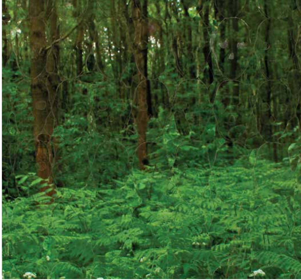
İsimsiz//Untitled Detay // Detail