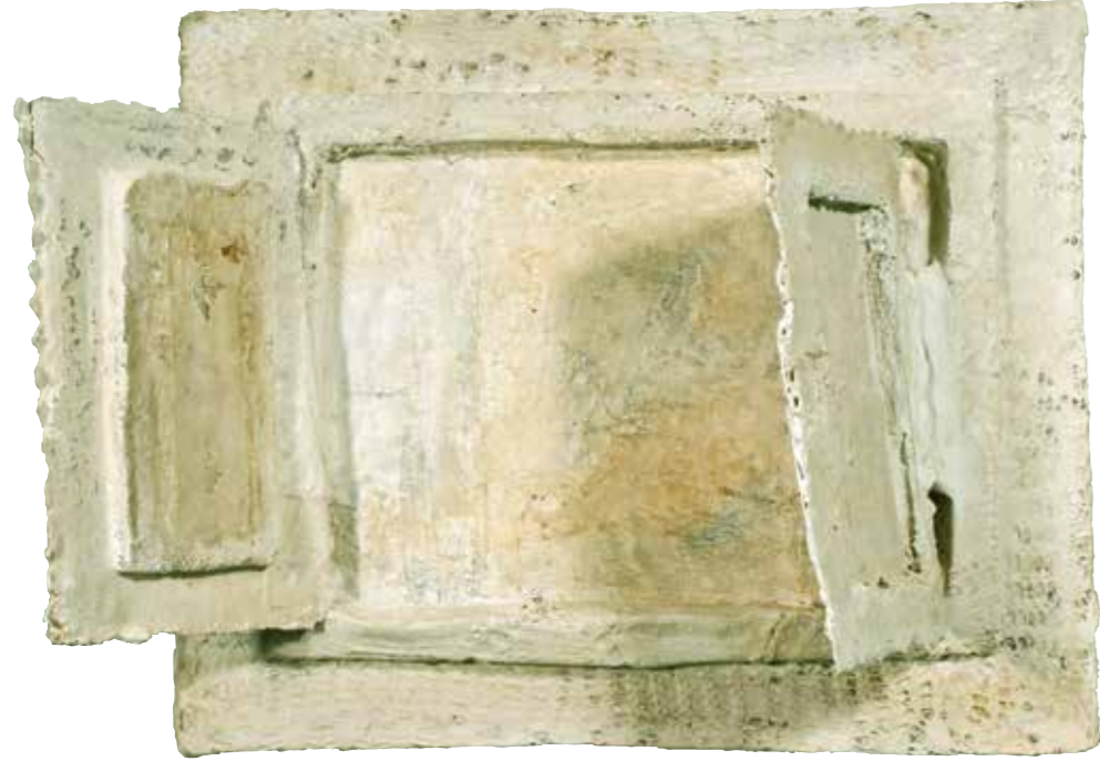
Pencere//The Window 140x200cm Flowstone Heykel//Sculpture 2009-2011