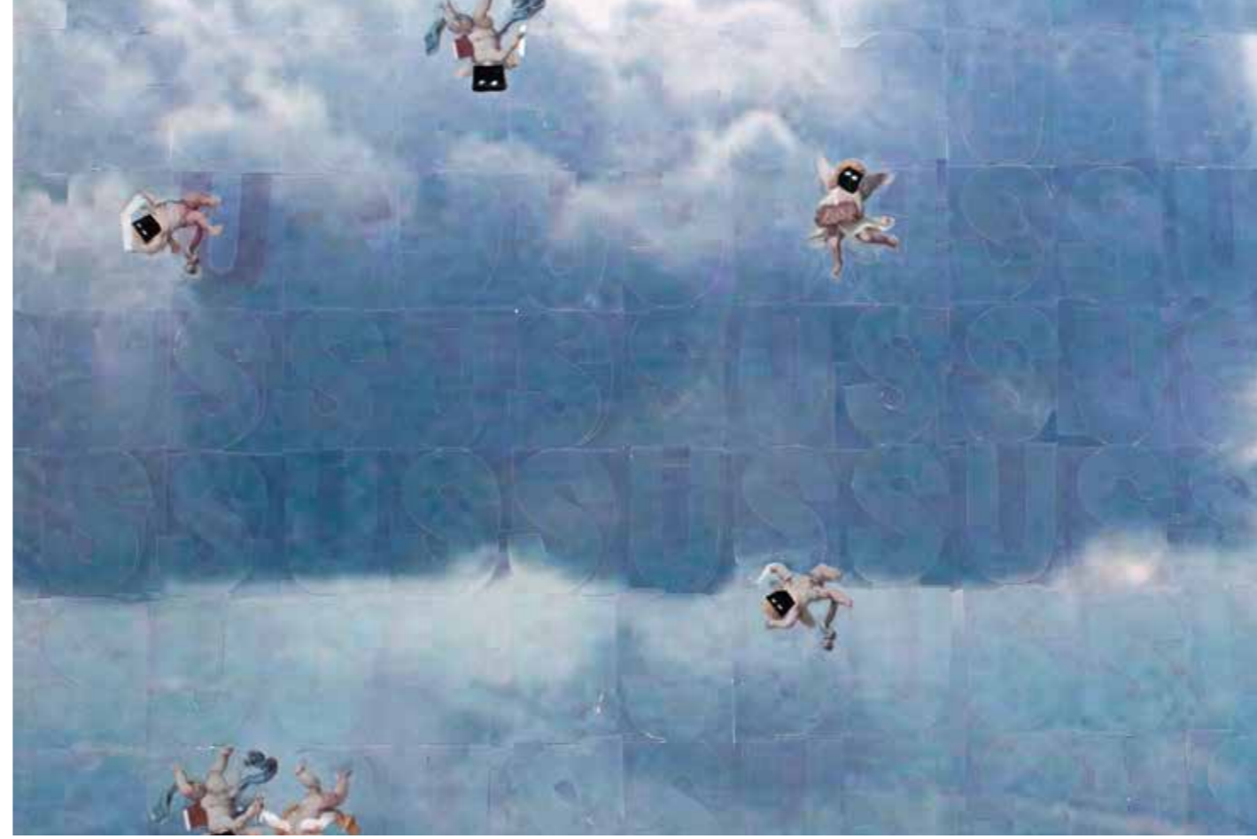
Sus//Shush Detay // Detail