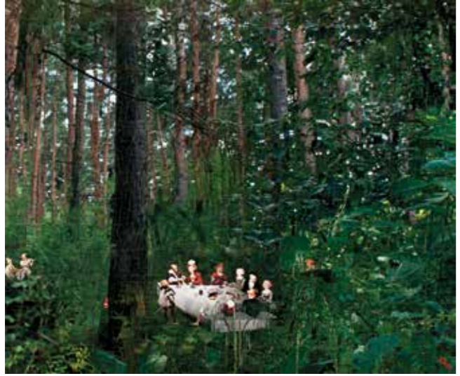
Zamana Sahip Çık Save the Time 220x240cm Panel üzerine kağıt teknik Mixed media on panel 2011