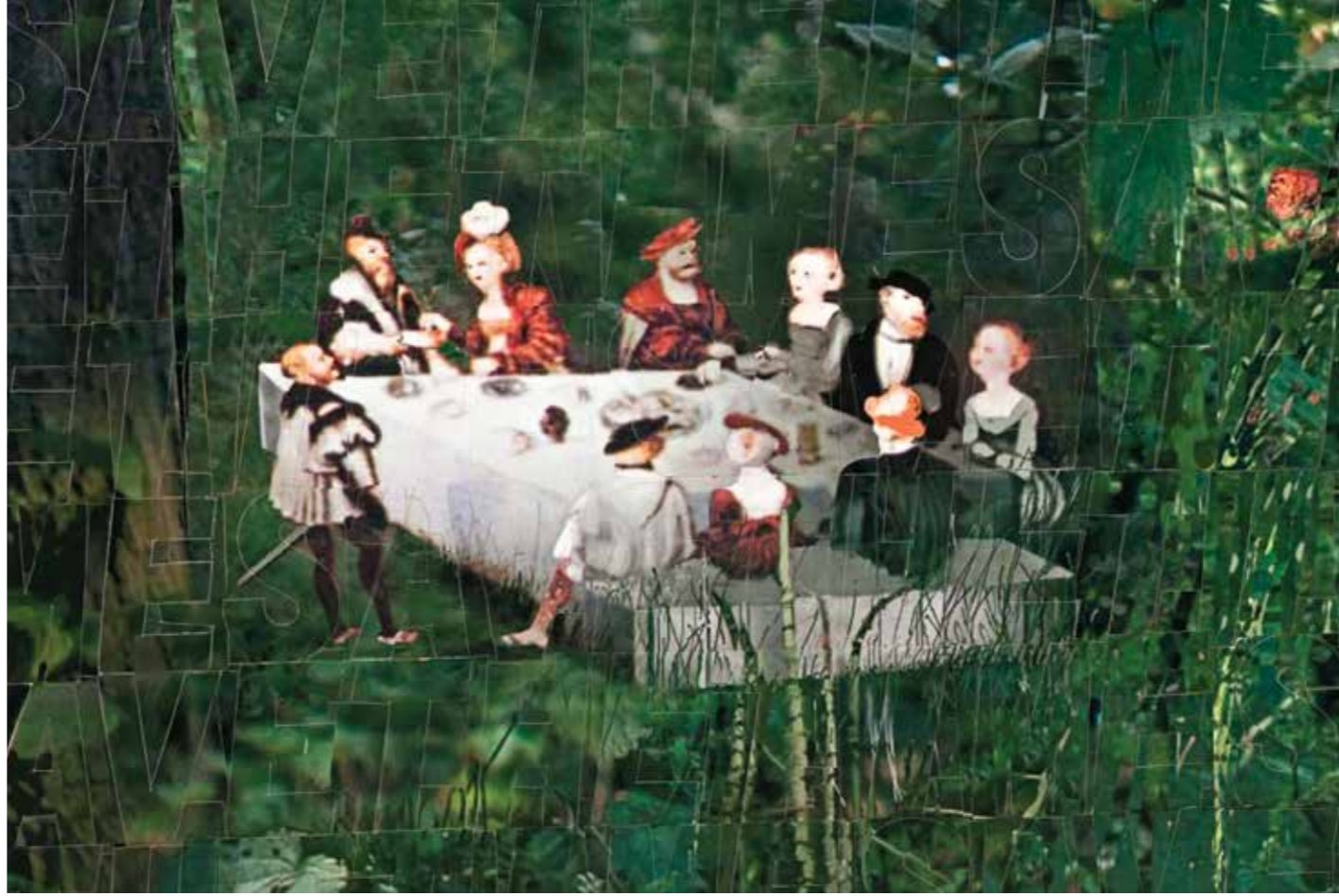
Zamana Sahip Çık Save the Time Detay // Detail