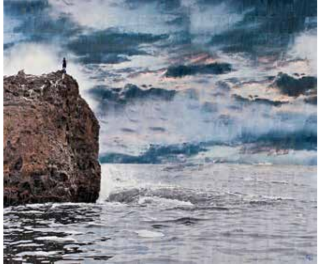
Fırtına//The Storm 210x250cm Panel üzerine karışık teknik Mixed media on panel 2011