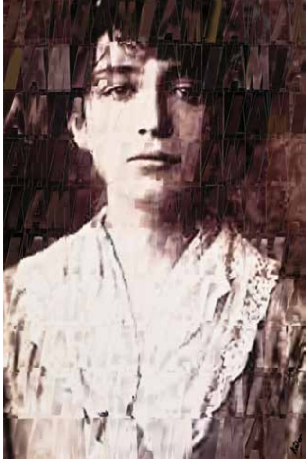
Benim!!! am! 180x116cm Tuval üzerine karışık teknik Mixed media on canvas 2011