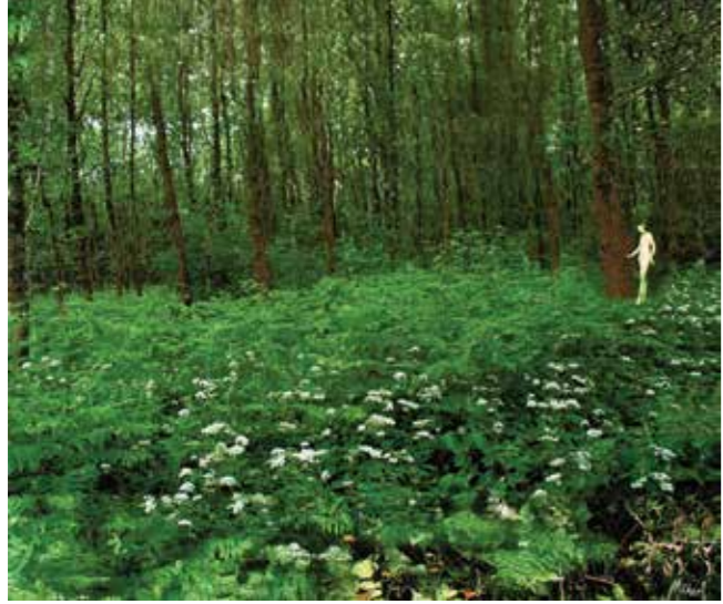
İsimsiz//Untitled 210x250cm Panel üzerine karışık teknik Mixed media on panel 2011