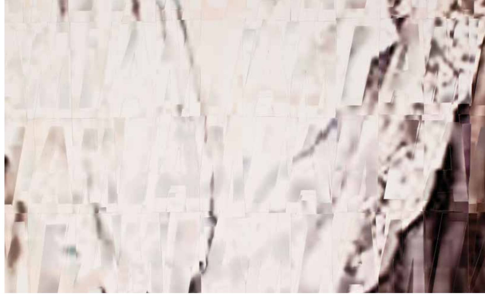
Benim!!! am! Detay // Detail