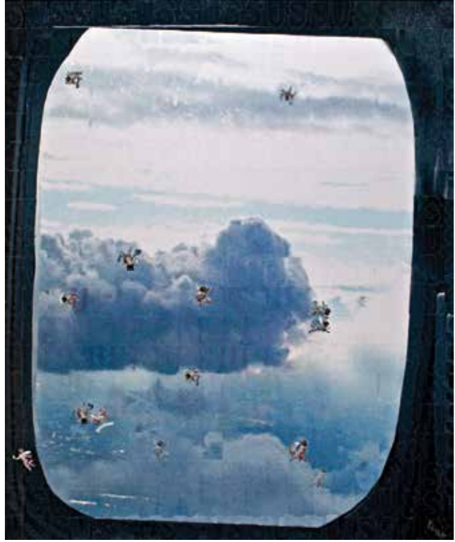
Sus//Shush 240x220cm Panel üzerine karışık teknik Mixed media on panel 2011