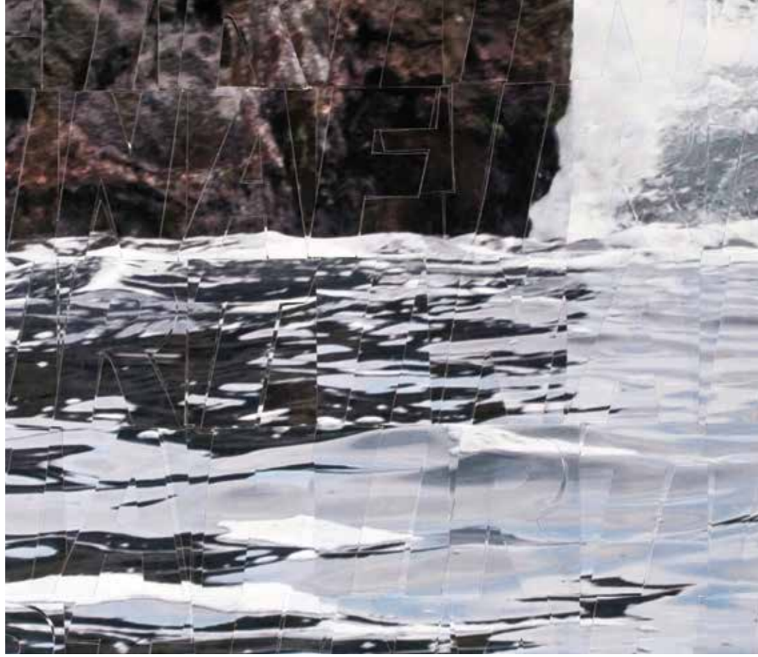
Fırtına//The Storm Detay//Detail